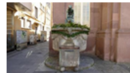
Wasserschöpfender Knabe von Konrad Taucher