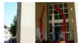
Tor/Turm von Walter M. Foerderer