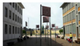
Platz der Grundrechte von Jochen Gerz