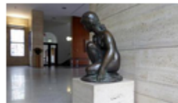
Knieendes Mädchen von Carl Egler

Entdecken Sie die Kunstwerke mit dem mobilen Führer. Beim ersten Mal werden Sie gefragt, ob Ihr Standort ermittelt werden darf. Das dient dazu, Ihnen die nächstgelegenen Denkmale zu zeigen. Lehnen Sie dies ab, beginnt Ihr Rundgang fiktiv auf dem Karlsruher Marktplatz. Es werden in keinem Fall personenbezogene Daten gespeichert.